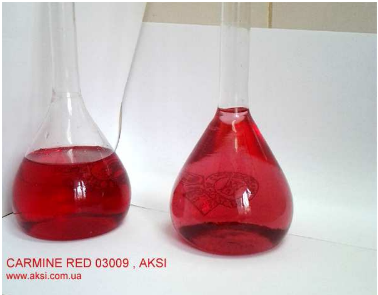
CARMINE RED 03009 , AKSI www.aksi.com.ua